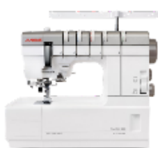
CoverPro 3000 Professional