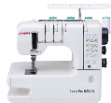
CoverPro 1000 CPX