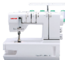
CoverPro 2000 CPX